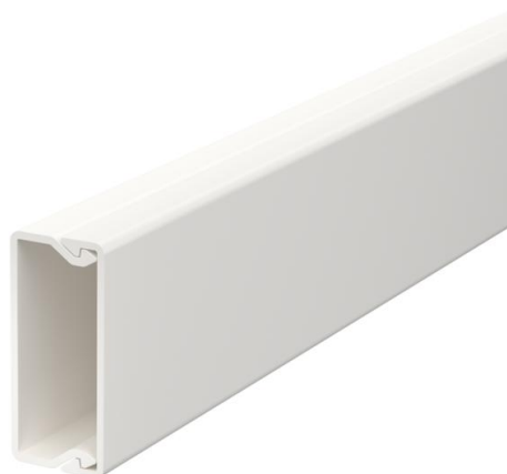
Canale con coperchio