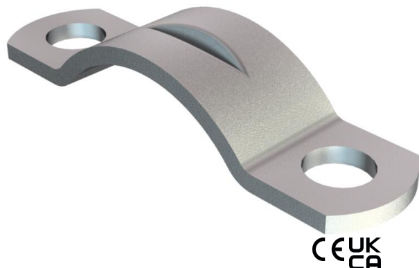
Morsetto scarico di trazione 8mm