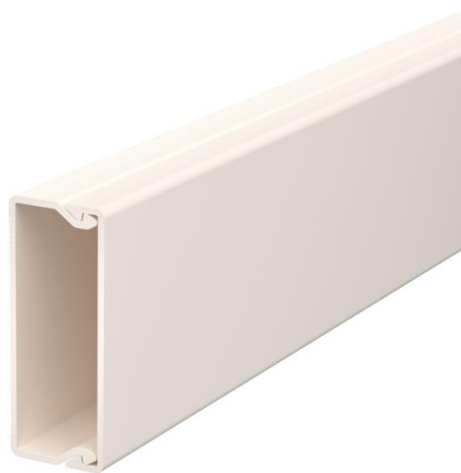
Canale con coperchio